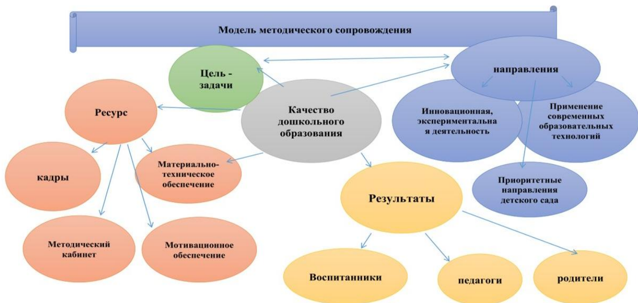
Рисунок 2. Модель методического сопровождения ДС № 106 «Изюминка»

В 2023г. детский сад укомплектован педагогами в количестве 20 человек.